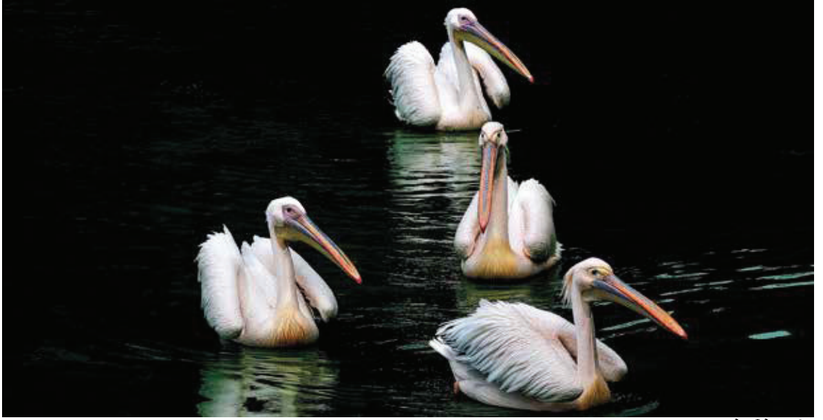
दुलो घाउँके त्वासील